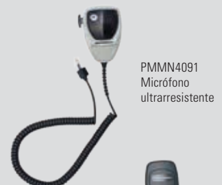
PMMN4091 Micrófono ultrarresistente