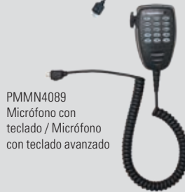
PMMN4089 Micrófono con teclado / Micrófono con teclado avanzado