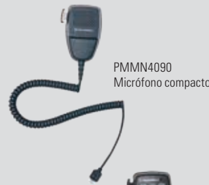
PMMN4090 Micrófono compacto