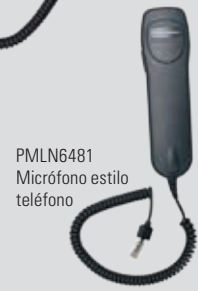
PMLN6481 Micrófono estilo teléfono