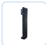
Clip para el cinturón