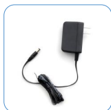
Adaptador de energía 12 V/1 A