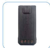
Batería de Li-ion 1500 mAh

ACCESORIOS ESTÁNDAR: ACCESORIOS OPCIONALES: