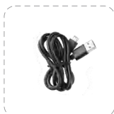
Cable de tipo-C