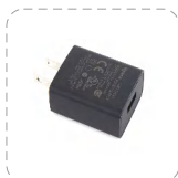
Adaptador de energía (USB)