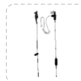
Auricular con tubo acústico transparente