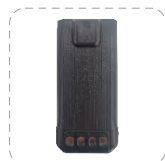
Batería de Li-ion 2200 mAh